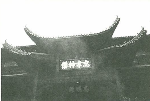
道遙山萬壽宮忠孝神僊區