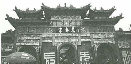
江山道遙山萬壽宮