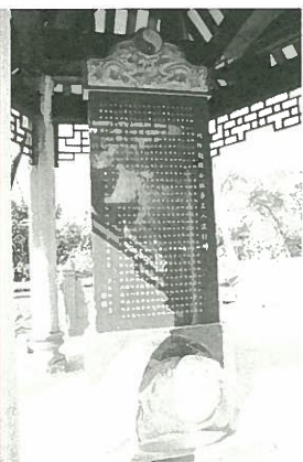
純陽觀開山祖李真人道行碑

在純陽觀，我們看到了古老的道教在新的歷史時期煥發出的勃勃生機，我們相信通過我們當代道教徒的共同努力，一定能將祖師的大道傳承下去，並將之發揚光大。（本文由純陽觀供稿）