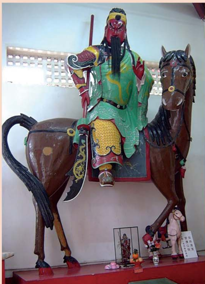
萬佛寺的騎馬關公像