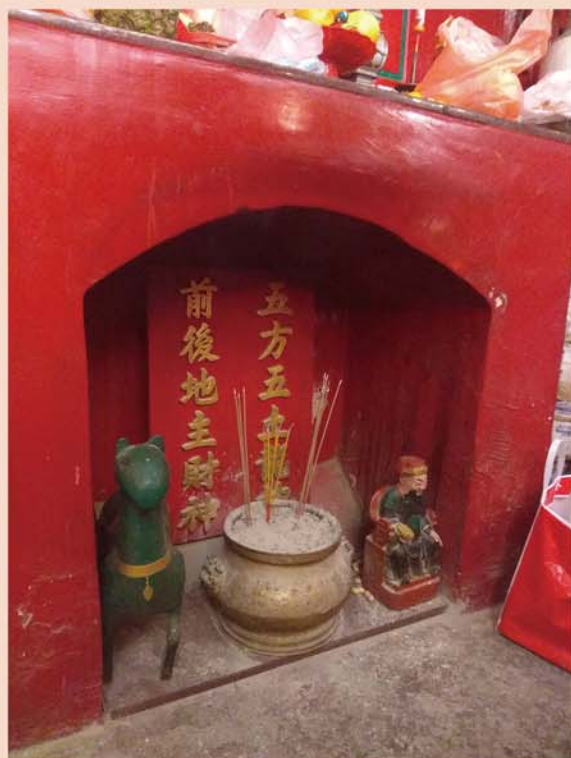
土地壇兼祀貴人祿馬

這些神靈信仰在香港也有供奉，加上香港有賽馬活動，額外帶動對馬神的崇拜。沙田萬佛寺準提殿供奉一尊騎馬關公，高約十五尺，宏偉莊嚴。筲箕灣張飛廟及深水埗關帝廟門外亦有供奉關公座騎「赤兔馬」，日常吸引許多馬迷到寺供奉，祈求馬運亨通；此外，沙田馬場員工宿舍設有一座伯樂廟，設壇近五十年，專奉伯樂為祖師，馬會員工藉其善於相馬馴馬之威能，請祖師保佑工作平安順暢，馬匹健康，此亦香港獨有的信俗。